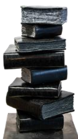
Obraz 3a. biblioteka.png przed transformacją; rozmiar 150 px na 235 px