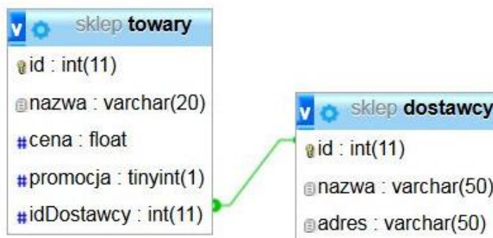
Obraz 1. Baza danych

Tabele w bazie sklep wykorzystane w zadaniu przedstawione są na obrazie 1. Pole promocja przyjmuje wartość 0, gdy towar nie jest objęty promocją lub wartość 1, gdy towar jest objęty promocją. Tabele połączone są relacją opartą na polach: idDostawcy w tabeli towary oraz id w tabeli dostawcy .