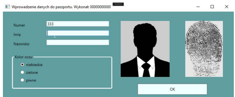
Obraz 3. Po opuszczeniu pola edycyjnego „Numer”

Na obrazie 1 przedstawiono ideę aplikacji desktopowej. W zależności od użytego środowiska programistycznego wygląd może nieznacznie się różnić.